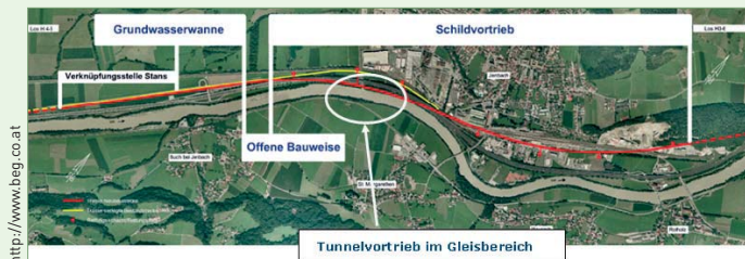
▲ Abb.2: Übersicht Tunnelbaustelle Jenbachtal