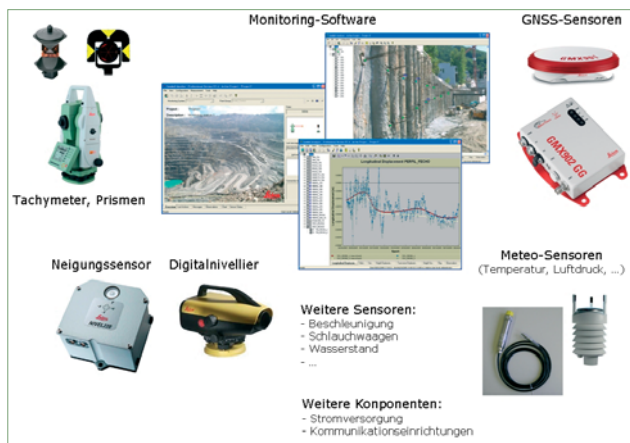
Abb.1: Typische Komponenten eines Monitoring-Systems

Flexibilität, Skalierbarkeit und individuelle Konfigurierbarkeit eines Monitoringsystems werden am besten mit standardisierten Schnittstellen und einer offenen Softwarearchitektur erreicht. Erfüllt das System diese Forderungen, so können Lösungen in der Regel auf die individuellen Anforderungen eines jeden Monitoring-