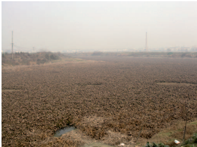
Das durch aggressive Wasserhyazinthen zerstörte ökologische Gleichgewicht im Flussgebiet