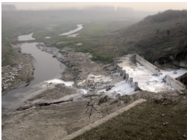
Unkontrollierte Einleitung des nicht geklärten Abwassers aus einer Papierfabrik

Die chinesische Wirtschaft entwickelt sich ungebremst mit jährlichen Wachstumsraten um 10%. Die Kehrseite dieser explosionsartigen Entwicklung sind steigende Umweltschäden, die immer deutlicher sichtbar werden. Vielerorts sind verschmutzte Gewässer und ruinierte Biotope zu sehen. Es bleibt kaum Zeit zur Erstellung und Umsetzung ausgereifter Konzepte zum Schutz von Ökosystemen, Klima, Wasser, Luft und Boden.